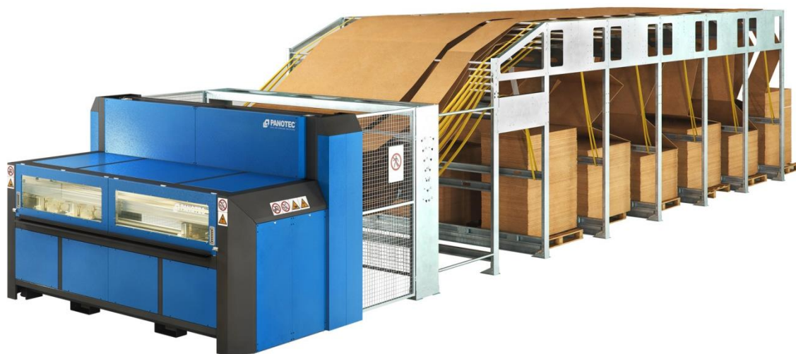
Image 1: Le Boxmaker travaille avec du carton ondulé en continu et est capable de traiter jusqu'à 6 qualités de carton ondulé différentes de manière entièrement automatique. Nous proposons des qualités spéciales à la demande du client.