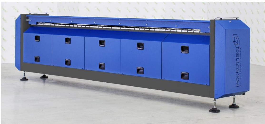
Abb 2: Der Digitaldrucker ist vollständig in den Fertigungsprozess eingebettet. Das bedeutet, dass kein separater Fertigungsprozess für die Bedruckung notwendig ist und die Bedruckungskosten so auf einem Minimum gehalten werden können.