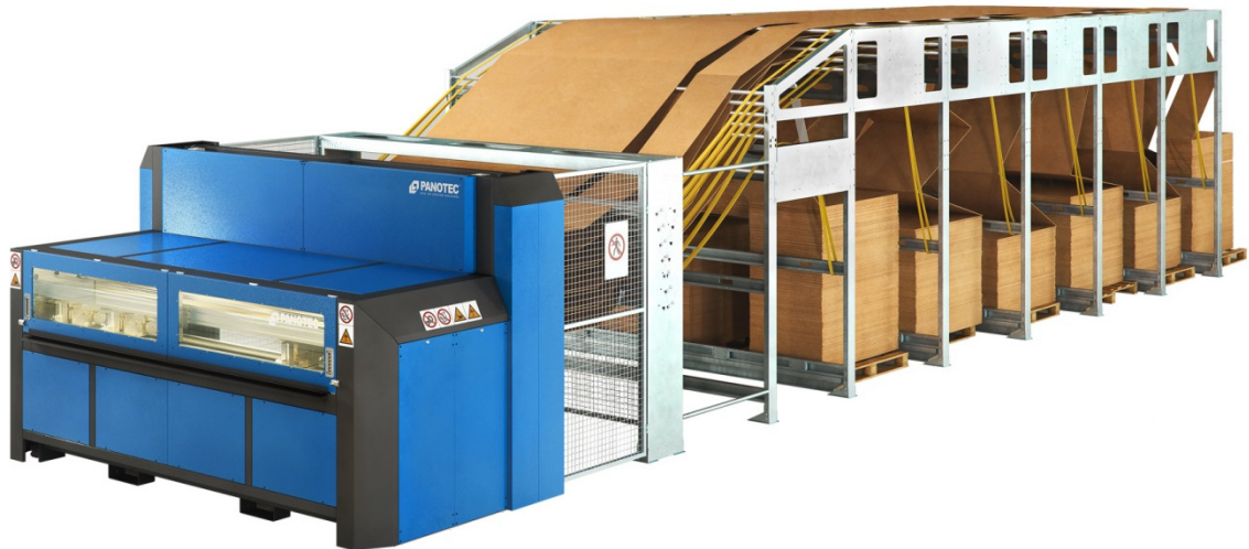
Abb 1: Der Boxmaker arbeitet mit Endloswellpappe und ist in der Lage, bis zu 6 verschiedene Wellpappenqualitäten vollautomatisch zu verarbeiten. Sonderqualitäten bieten wir auf Kundenwunsch an.